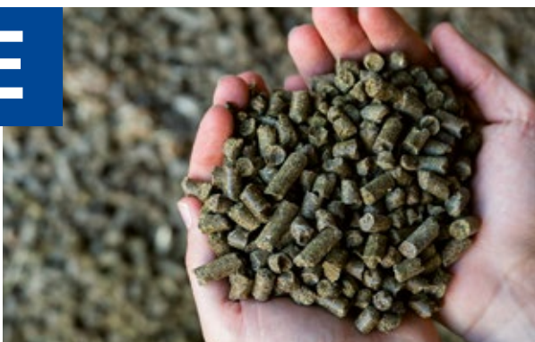
Cels minéraux / vitamines