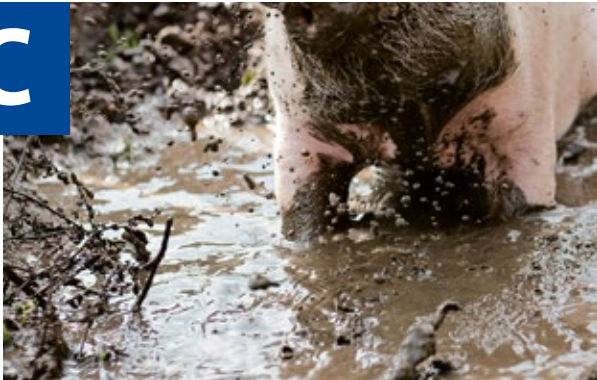
Bain de boue