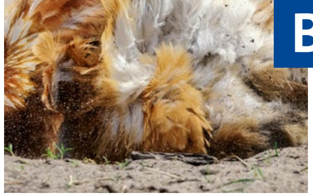
Bain de sable